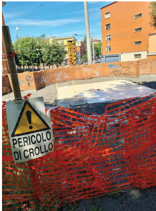
L'area dove dovrebbe sorgere il chiosco con i muri pericolanti che affacciano su Via Milazzo e