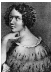
Elena Lucrezia Cornaro Piscopia

26 luglio 1684, Elena Lucrezia Cornaro Piscopia muore a soli 38 anni, probabilmente di tubercolosi. E' stata la prima donna al mondo a laurearsi nel 1678 all'Università di Padova con un dottorato in filosofia. Venezia, città che le ha dato i natali nel 1646, la ricorda con una lapide apposta a Calle del Carbon.