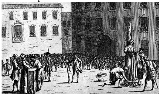
stampa d'epoca -esecuzione dei patrioti della Partenopea-

8 dicembre 1748 nasce Francesco Mario Pagano, giurista, politico e patriota italiano, martire della repubblica Partenopea, nel 1799. Insieme a lui furono condannati a morte per aver voluto la libertà, altri 120 patrioti. Tra loro anche Eleonora Fonseca Pimental.