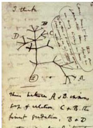
L’albero della vita - disegno di Charles Darwin

16 settembre 1835 Charles Darwin sbarca nelle isole Galapagos. Furono gli studi su alcuni degli animali che popolano queste isole a fornire allo scienziato i presupposti per formulare la teoria dell'evoluzione.