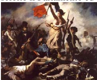
Delacroix, La libertà guida il popolo .

27 luglio 1830 E' l'inizio delle tre "Gloriose giornate" in Francia. Il popolo insorge ed abbatte il governo assolutista di Carlo X, che aveva cercato di ripristinare i privilegi del clero e della nobiltà, sciolto il Parlamento ed abolito la libertà di stampa.