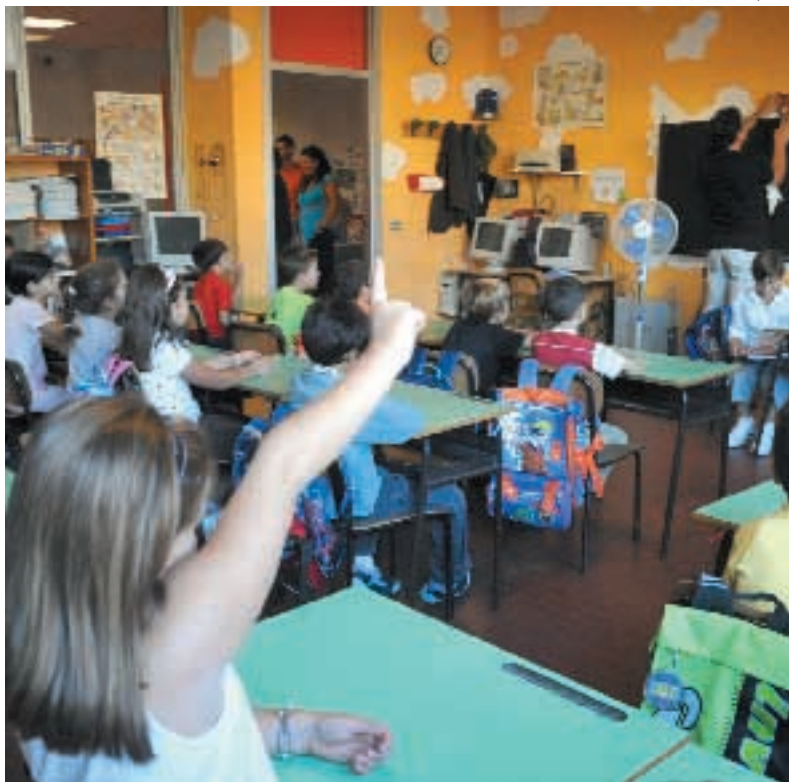
Una classe delle elementari

La giunta Delbono annuncia per settembre una serie di provvedimenti salva-scuola: ore di didattica ricreativa per coprire chi non può usufruire del tempo pieno e «nidi garantiti» per i cassintegrati e gli atipici senza lavoro.