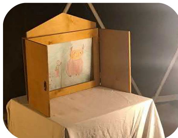
Illustrazione condivisa di poesie per kamishibai – foto 2 e 3

Un pomeriggio di dicembre abbiamo portato le poesie illustrate in strada, appena fuori dal teatro Testoni. Tutti avevano un compito: a gruppi si leggeva le poesie ai passanti, altri fermavano le persone per invitarle ad ascoltare, altri ponevano domande sul valore della poesia.