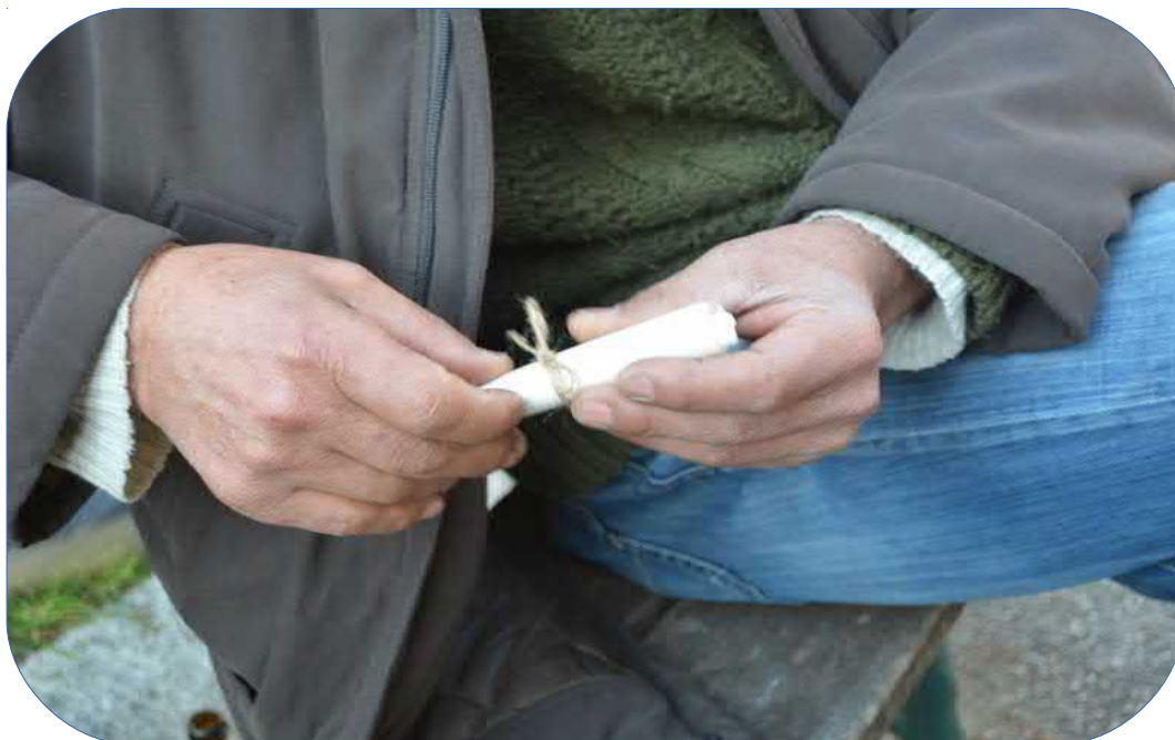
Una poesia tra le mani può cambiare le cose? – Foto 7

Questa raccolta di riflessioni è stata utile ad evidenziare gli obiettivi e gli apprendimenti che questa esperienza ha generato.