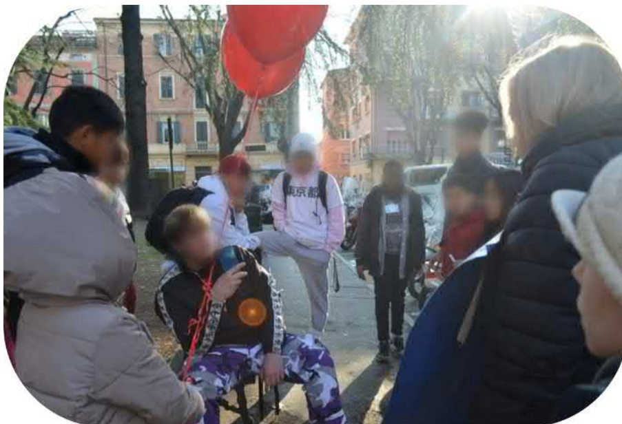
La poesia può trasformarsi in un brano rap – foto 4

Da un incontro può nascere una nuova ricerca, da una proposta interessante possono emergere nuovi rilanci progettuali