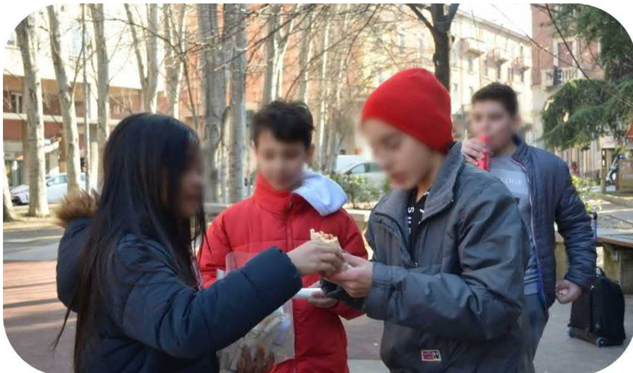
Foto 1 – Prima uscita a Piazza dell'unità: dialoghi ed ascolto di poesie in quartiere

“Una poesia per te. Una poesia può far cambiare le idee” N. 10 anni