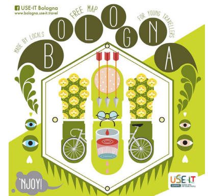
Cover delle prime tre edizioni di USE-IT Bologna.

2) La scritta "ACT LIKE A LOCAL": con una lunghezza compresa tra i 10 ed 13 cm ed un' altezza compresa tra i 2 cm ed i 3,5 cm.