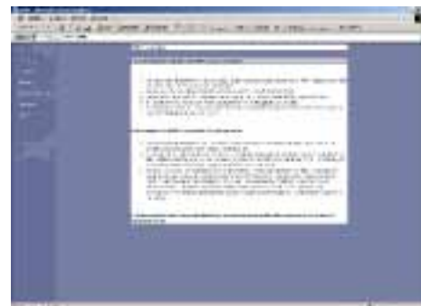
Il sito di SWIFT

La persona anziana e/disabile oppure chi per lei sta effettuando la ricerca di un servizio o di una prestazione potrà accedere al sistema Swift mediante l'aiuto di un operatore, ricercare la disponibilità del servizio richiesto in un ampio numero di centri erogatori e fare una prenotazione o una pre-registrazione. Il sistema inoltre consentirà di verificare l'elenco delle prenotazioni realizzate da ogni senior e di modificare successivamente le prenotazioni effettuate.