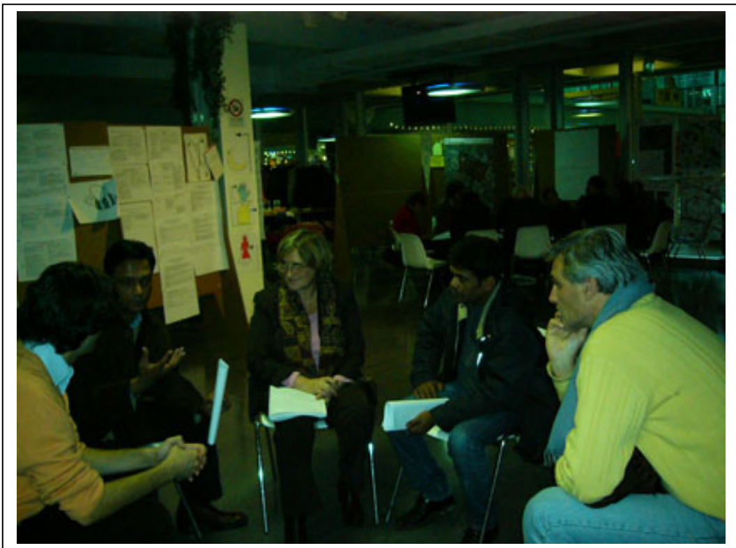
Fig. 12 – Il gruppo Scuola Multietnica per i bimbi e Ristorante multietnico discute le proposte.