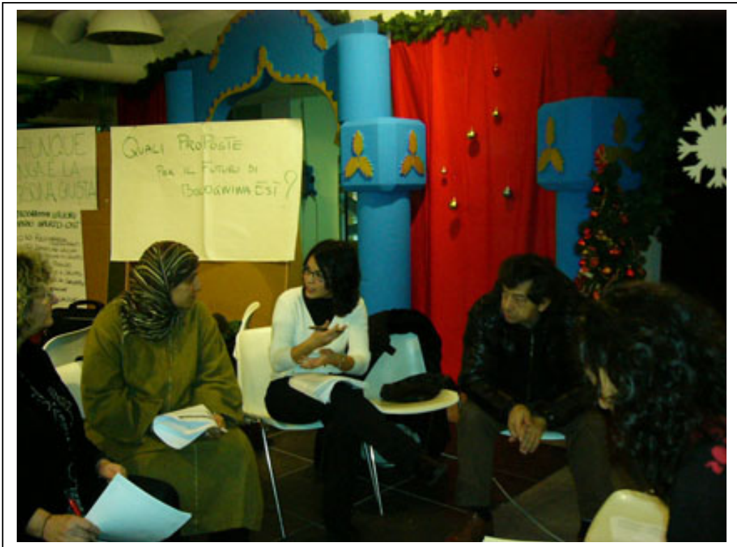
Fig. 11 – Il gruppo Autogestione e Integrazione discute dei temi proposti.