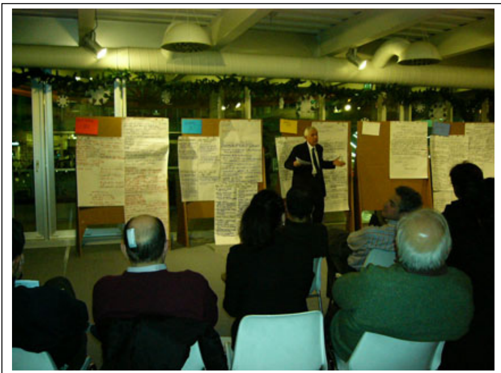
Fig.9 – Momento di plenaria e presentazione delle idee di ciascun gruppo.