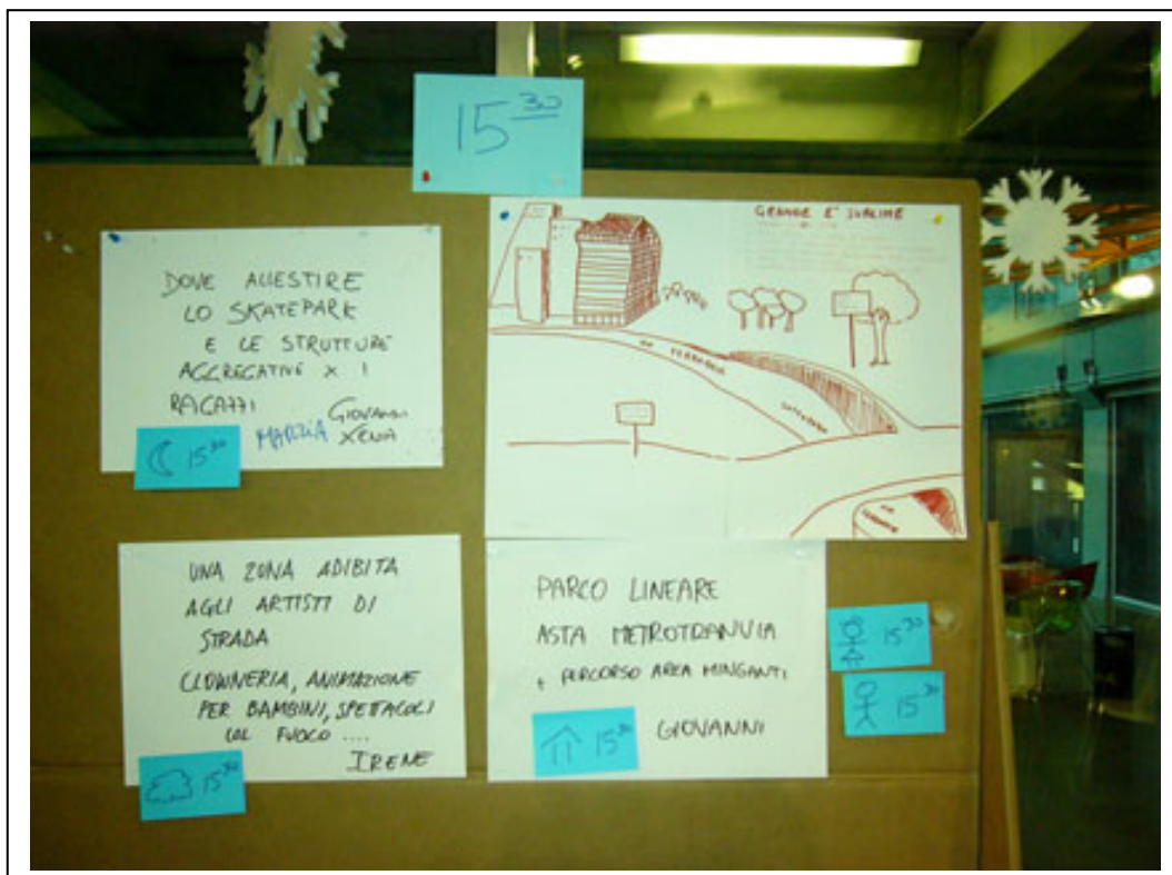
Fig.10 - Proposte di gruppi di discussione affisse in bacheca