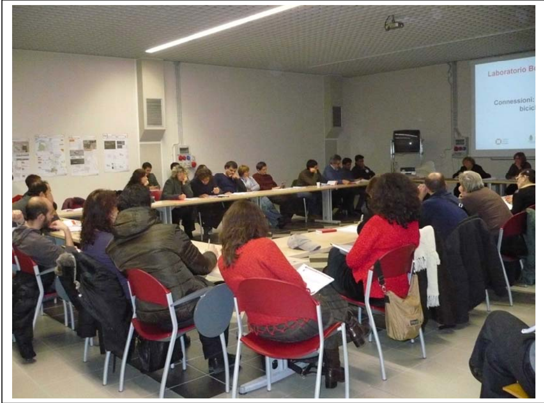
Fig,13 – Assemblea “Le migliori idee per la Bolognina Est” presso la Sala Fondazione Aldini Valeriani .