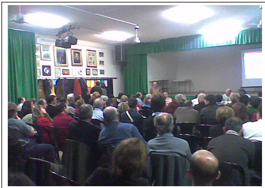
Fig.1 – Un momento dell’assemblea inaugurale “Bolognina Est al via” presso il Centro Sociale Montanari in via Ferrarese.

L’assemblea dell’11 novembre si svolge in una grande sala, il centro sociale e culturale “Montanari” nel cuore della Bolognina Est, normalmente utilizzata a scopi culturali e di aggregazione dalla popolazione del quartiere, attrezzata con angolo bar ed un palco(tipo teatro) situato di fronte all’entrata, separato da essa da un ampio spazio in cui erano state distribuite e sistemate le sedie, che presto si sono riempite (e non sono bastate). Sulle pareti della stanza sono stati attaccati manifesti in cui compaiono vedute aeree della zona Bolognina Est e in cui vengono evidenziate le aree in trasformazione. Accanto alle immagini alcune informazioni fondamentali (cifre, metriquadrati da destinare agli usi, legende).