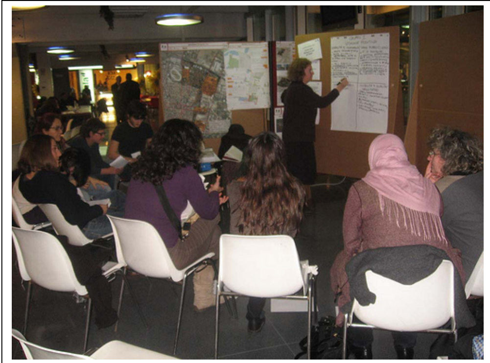
Fig. 8 – Il mio gruppo di discussione nel Laboratorio Scenario