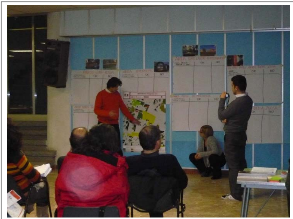
Fig.6 – Altro momento illustrativo dell'incontro "Verde Vivere. "