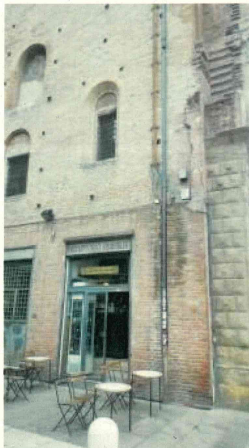
Vista vetrina in affaccio Piazza Nettuno