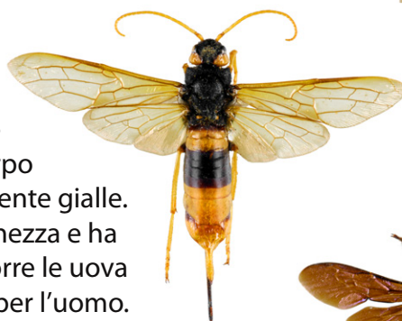
Sirice gigante/vespa del legno, Urocerus gigas

La vespa Mammut , Megascolia maculata flavifrons , è una delle più grandi vespe europee. Per questo motivo è frequentemente confusa con il calabrone asiatico. E' ricoperta da una fitta peluria e presenta un corpo nero lucido. La testa sopra è gialla e l'addome presenta 4 zone gialle e glabre. E' un parassita di larve di grossi coleotteri (come il maggiolino).