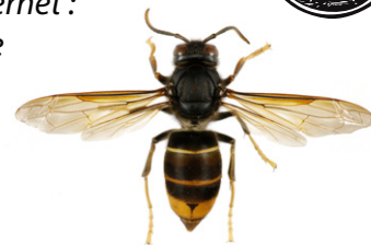
Calabrone asiatico/calabrone a zampe gialle, Vespa velutina var. nigrithorax

Il calabrone europeo , Vespa crabro , ha un addome giallo chiaro, con bande nere. La testa di fronte è gialla e sopra rossa. Il torace e le zampe sono nere e bruno-rosastre. Le operaie misurano fra 18 e 23 mm e le regine fra 25 e 35 mm.