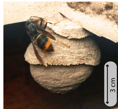
Calabrone asiatico a zampe gialle, Vespa velutina var. nigrithorax

A primavera, ogni regina fondatrice costruisce da sola il suo nido in un luogo spesso protetto. Nella maggior parte delle vespe il nido inizialmente rassomiglia ad una piccola sfera da 5 a 10 cm di diametro con un'apertura verso il basso. Nei calabroni, la colonia non esiterà a spostarsi se l'ubicazione non risulterà più adatta (mancanza di spazio o di sicurezza).