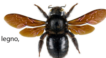
Ape legnaiola, Xylocopa violacea

L' ape legnaiola , Xylocopa violacea , misura 20-30 mm ; è completamente nera con riflessi blu violacei. La femmina di questa ape solitaria costruisce il nido nel legno morto e raccoglie polline per nutrire le larve.