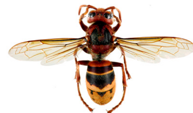
Calabrone europeo, Vespa crabro

Il calabrone orientale , Vespa orientalis , ha la stesse dimensioni del calabrone europeo. Ha un corpo rossiccio e solo la testa, vista di fronte, ed una banda dell'addome sono gialli. E' presente solo nel sud-est europeo (sud Italia, Malta, Albania, Grecia, Romania, Bulgaria).