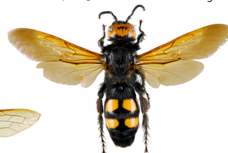
Vespa Mammut, Megascolia maculata flavifrons

La vespa del legno , Urocerus gigas , è un imenottero la cui larva si nutre di legno. Questa vespa a bande nere e gialle può essere facilmente distinta dal calabrone per il suo corpo cilindrico e le sue lunghe antenne completamente gialle. La femmina può raggiungere i 45 mm di lunghezza e ha un lungo ovopositore che le permette di deporre le uova nei tronchi d'albero. Questa specie è innocua per l'uomo.