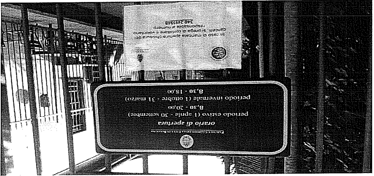
Fig.1 avviso del contatto telefonico ai cittadini

Per questo giardino come quello di Garibaldini di Spagna e San Giuseppe sono stati affissi un avviso (figura 1) con numero di cellulare attraverso il quale ogni cittadino qualora dovesse avvenire un eventuale altro problema, potrebbe contattare favorendo od ampliando in questo senso la nostra rete di comunicazione per essere più che vicino ai cittadini nel garantire un loro umile diritto di frequentare le aree verdi da noi assegnate con grande serenità.