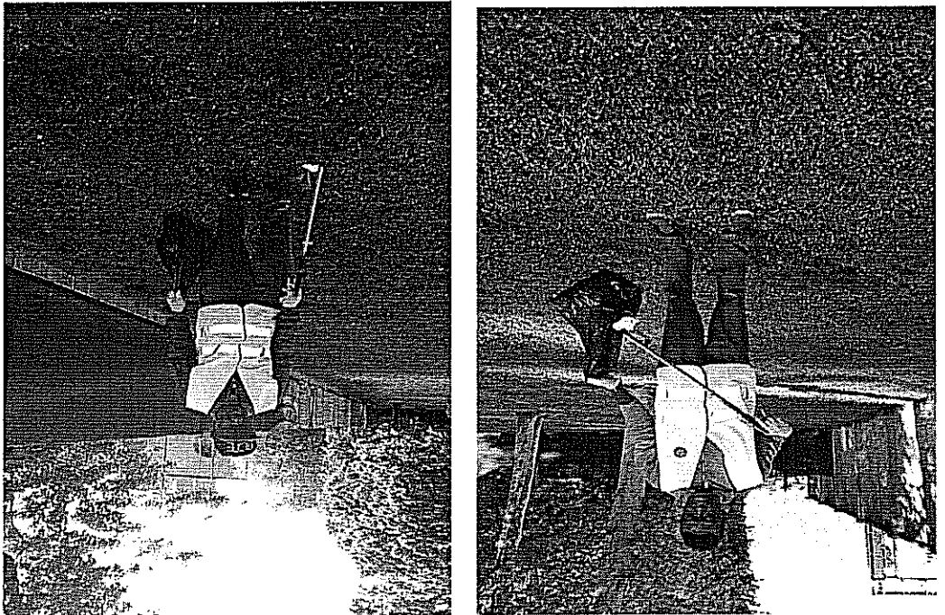
fig 2 scuola mario rocca

Report da Gilles Segnala che hanno raccolto dei bicchieri in vetro con alcuni bottiglie di birra nell'area della scuola oltre i rami degli alberi ed altri rifiuti che continuano a raccogliere ogni mattina entro le ore 8,30.