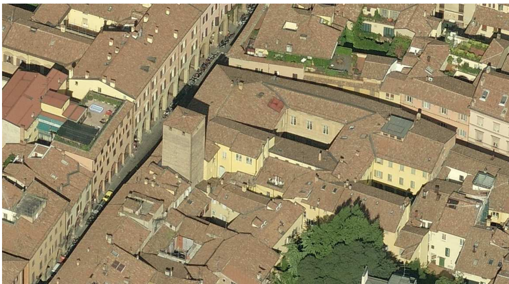
Museo della Musica – Vista dall'alto