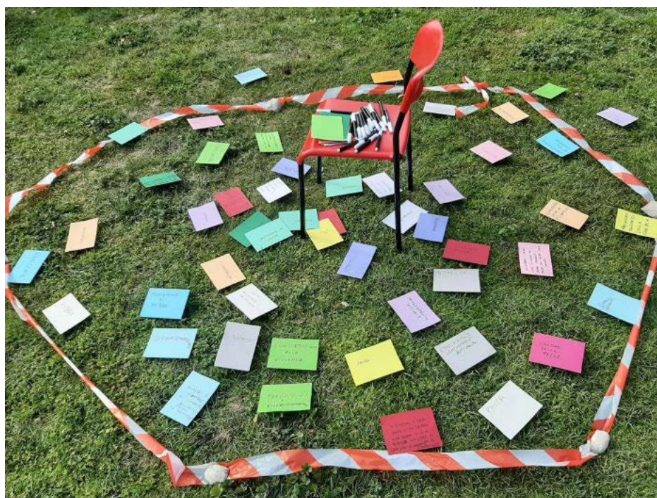
Immagine di un momento dell'EM tenuto a Bologna

Gli Educational Modules possono e debbono essere un esercizio di partecipazione non solo per le metodologie applicate nel loro svolgimento, ma anche e soprattutto per la capacità di costruire relazioni permanenti e strutturate di collaborazione partecipativa, siano esse tavoli di lavoro, reti formali o informali, infrastrutture di mutuo aiuto, coordinamenti tra istituzioni e tra queste e le organizzazioni delle comunità e della società civile.