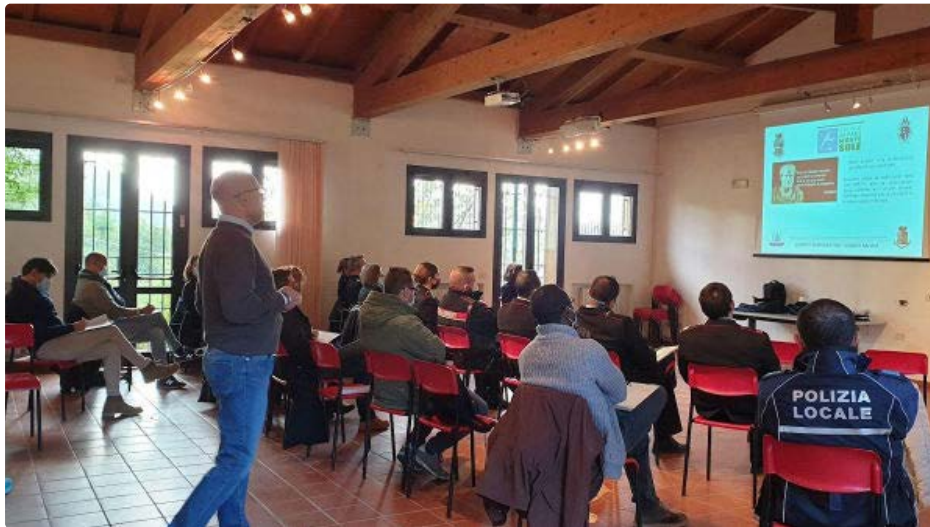
Educational modules a Bologna

Non meno preoccupante è la situazione in Italia: i dati ufficiali resi noti dalle autorità di Pubblica Sicurezza registravano, nel 2020, 848 crimini a sfondo razzista. Poco meno di tre al giorno, e ricordiamo che i crimini registrati non raggiungono, probabilmente, neppure il 20% del totale.