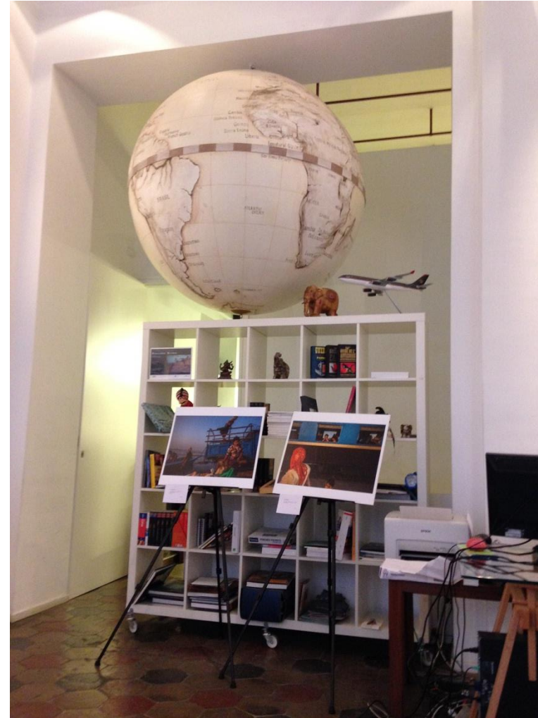
Le mostre di Milano e Roma