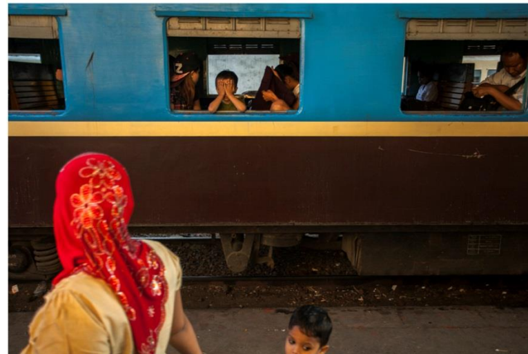
Alcune delle foto esposte di Ari Espay