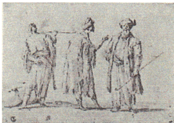
Attribuito a Giovanni Antonio Canal, detto il Canaletto (Venezia, 1697 - ivi, 1768)

Pietra nera naturale, pietra rossa naturale, gessetto bianco, su carta azzurra -143x122 mm -GDSU, 1854 F