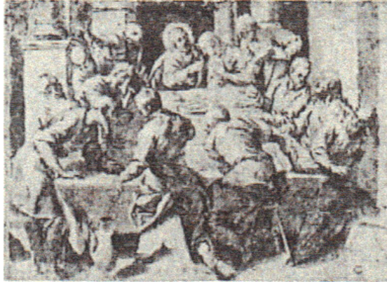
Jacopo Robusti, detto il Tintoretto (?) (Venezia, 1518 - ivi, 1594)