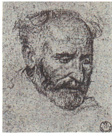
Attribuito a Paolo Caliari, detto il Veronese (Verona, 1528 - Venezia, 1588)

Penna e inchiostro marrone, pennello e inchiostro diluito marrone, biacca (carbonato basico di piombo), su carta cerulea - 278x382 mm -GDSU, 732 E