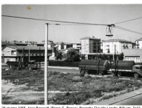
20 giugno 1989, Area Sarnelli (Piazza S. Rocco), Facoltà Ducale Longhi, BN (cm. 7x12)

Uno skate park provvisorio potrebbe essere realizzato nelle aree che saranno adibite a verde della Sani. Dovrebbe essere di piccole dimensioni, con poche rampe su un piano apposito, dai costi contenuti.