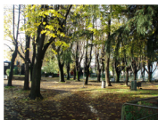
Deposito ferroviario, Via Micaela D'oro