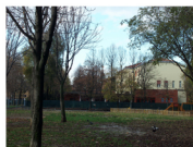
Giardino Fani, Via Micaela D'oro

Sarebbe molto utile una fontana vicino alla struttura. Non bisogna scordarsi delle ragazze: loro usano i roller.