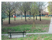
Giardino Sante Rossa, Via Micaela D'oro