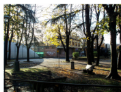
Deposito ferroviario, Via Micaela D'oro