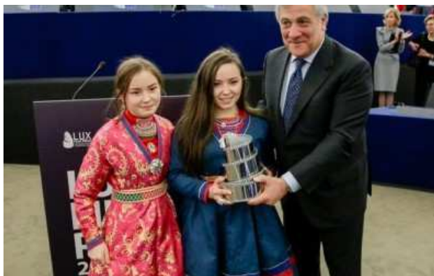
La protagonista del film Sàmi Blood riceve il premio dal Presidente del Parlamento europeo, Antonio Tajani. Strasburgo, novembre 2017