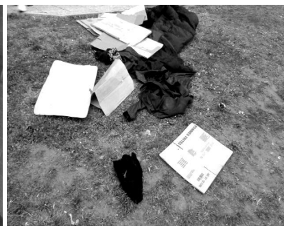
Cartoni, stracci, rifiuti e siringhe sono ormai consuetudine presso il Centro