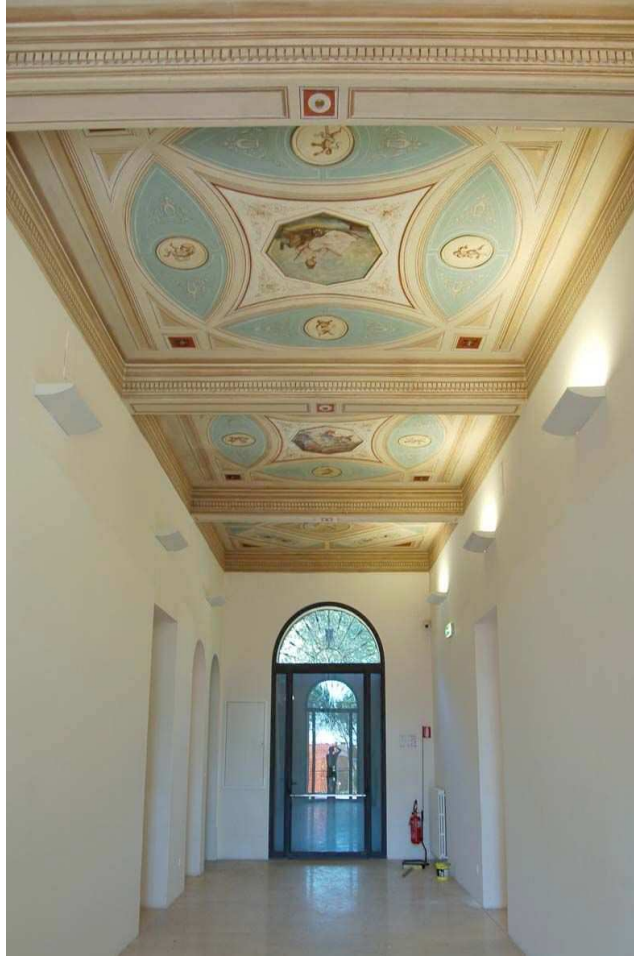
Corridio - piano terra / Ground floor- corridor