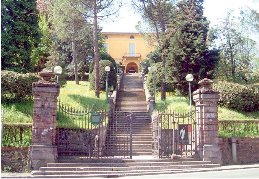
Entrata / Entrance View