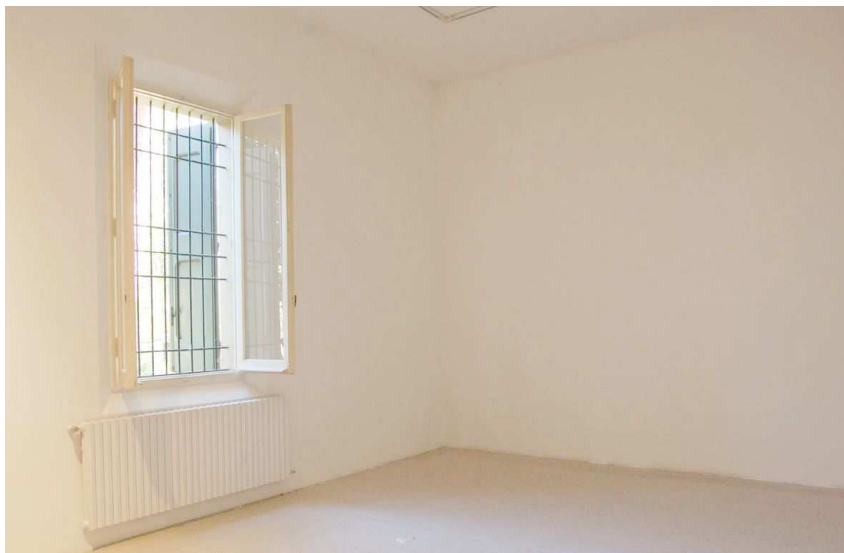
Sala - piano terra/ Ground floor - room

MAMbo - Museo d'Arte Moderna di Bologna Via Don Minzoni 14 | 40121 Bologna tel. +39 051 6496611 | info@mambo-bologna.org www.mambo-bologna.org