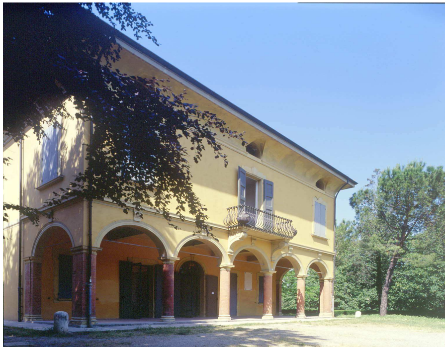
Facciata / Front view

MAMbo - Museo d'Arte Moderna di Bologna Via Don Minzoni 14 | 40121 Bologna tel. +39 051 6496611 | info@mambo-bologna.org www.mambo-bologna.org