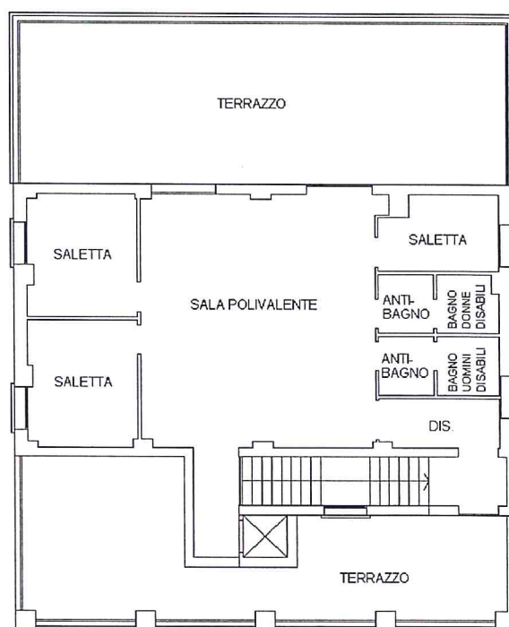
PIANO PRIMO H=2.91