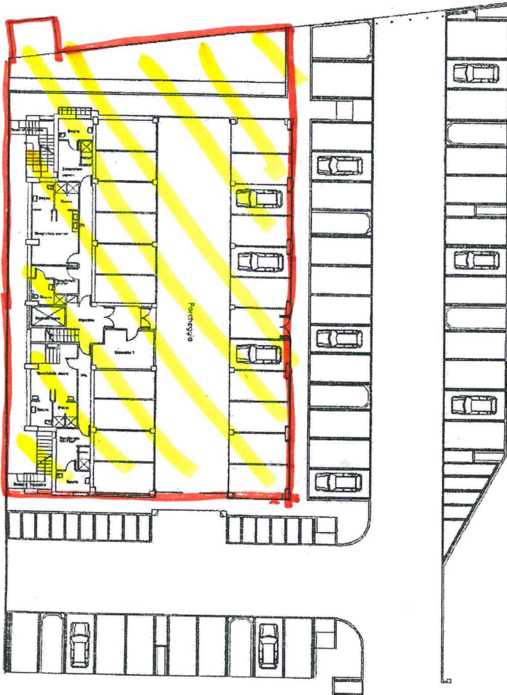
PIANTA PIANO TERRA H = 2.70