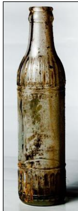
Una bottiglia sporca