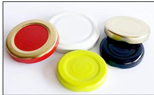
Un tappo di metallo