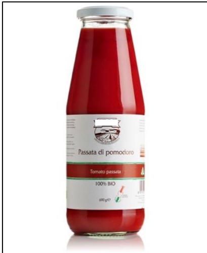
Un'etichetta di carta (ad esempio di una passata di pomodoro)

Per fare il vetro occorre tanta energia e tante materie prime e per questo riciclarlo è fondamentale. Ma attenzione. A volte nella campana del vetro possono finire delle cose che rendono difficile riusarlo. Tra questi sotto quali sono i NEMICI che NON devono finire nella campana del vetro? La soluzione la trovi dopo l'albero illuminato.