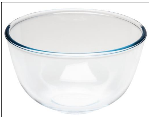
Una ciotola in pyrex