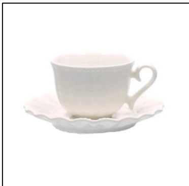
Una tazzina di porcellana