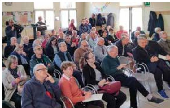
Assemblea pubblica sul progetto dell'interramento della Ferrovia BO-Portomaggiore - 9 novembre 2019