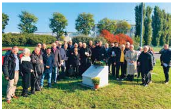
Commemorazione al cippo dedicato a Giuseppe Fanin - 10 novembre 2019