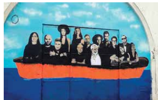
Murale dedicato a Francesco Guccini presso il ponte di Via Libia