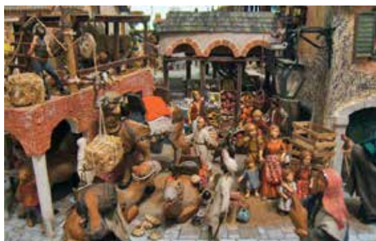
Presepe realizzato da Lino Bertone, cittadino del Pilastro, ed esposto in San Giovanni in Monte