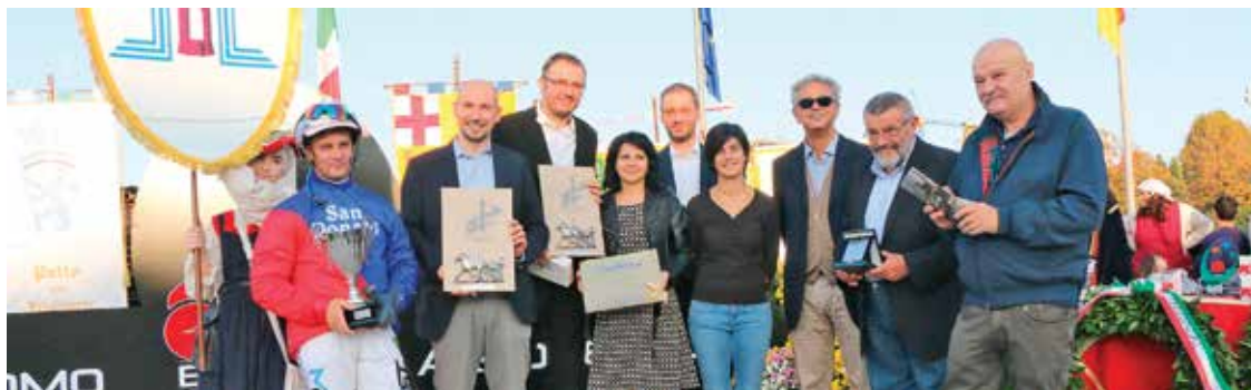
Premiazione del Palio dei Quartieri vinto da San Donato - 27 ottobre 2019