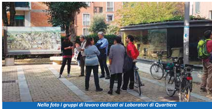
Nella foto i gruppi di lavoro dedicati ai Laboratori di Quartiere