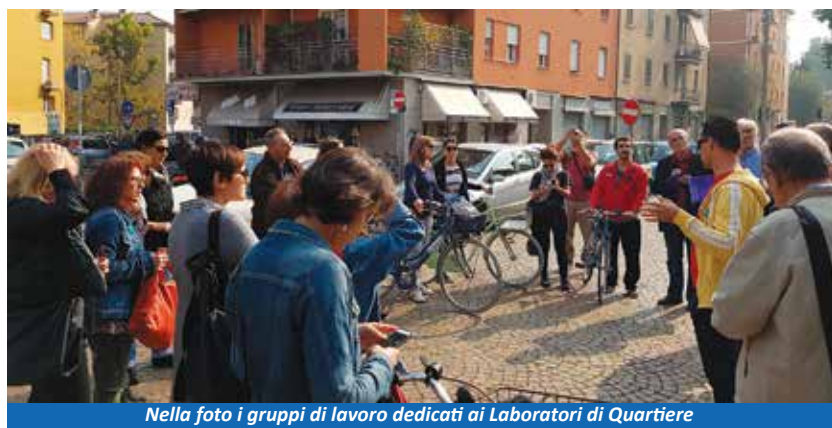
Nella foto i gruppi di lavoro dedicati ai Laboratori di Quartiere