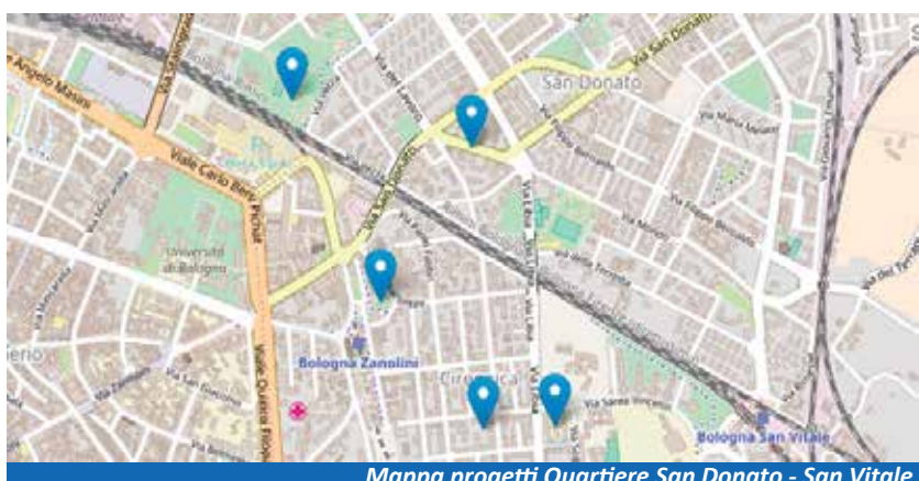
Mappa progetti Quartiere San Donato - San Vitale

Nota della Redazione Questo numero speciale è dedicato all'approfondimento del bilancio partecipativo nel Quartiere San Donato-San Vitale, con tutte le informazioni sulle modalità di voto e sulle 5 proposte progettuali che verranno sottoposte al giudizio dei cittadini dal 7 al 27 novembre. Unico altro argomento trattato in questo numero, data la rilevanza rivestita per tutta la comunità e per il territorio del Quartiere, è la visita di Papa Francesco a Bologna dello scorso 1 ottobre, raccontata in un apposito spazio a cura della redazione del blog Pilastro 2016 che ringraziamo. Con il prossimo numero, che uscirà entro il mese di dicembre, si tornerà come di consueto a pubblicare i contributi del Quartiere, dei gruppi consiliari, dei cittadini e delle associazioni su tutti gli altri temi di interesse del territorio.