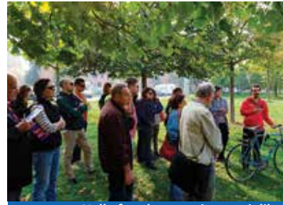
Nelle foto la camminata e i dibattiti dedicati ai Laboratori di Quartiere

Il progetto vuole contribuire ad un processo di riqualificazione e creazione di valore urbano attraverso l'uso del quartiere da parte dei residenti provvedendo al miglioramento dell'arredo urbano tramite installazione di arredi come sedute con un forma specifica identitaria al fine di abbellire lo spazio pubblico, che siano di qualità e difficilmente degradabili o imbrattabili. Si immagina anche la creazione di una pista ciclabile in Via Amaseo con rastrelliere in zona 'Mercato San Donato' e Piazza Mickiewicz. Con l'insediamento di arredi urbani coordinati e in-