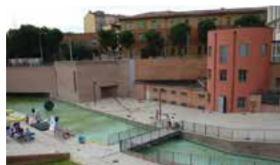
Il giardino del Cavaticcio dall'ex macello