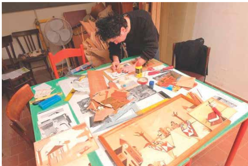
Un momento dei laboratori delle Stanze Educative

La frequenza delle Stanze Educative è articolata da un minimo di una mattinata ad un massimo di tre, e propone laboratori pratici artigianali, di falegnameria, ceramica, sartoria, serigrafia, arte-terapia, musicali, sportivi etc, riconosciuti a tutti gli effetti come frequenza scolastica.