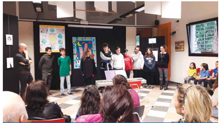
Alcuni Consiglieri del CQR durante la festa del 18 maggio al Graf

E' stato dunque chiesto agli studenti delle scuole coinvolte di riflettere sul tema