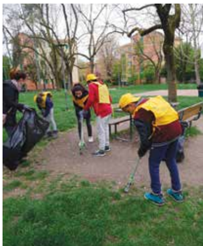
Pulizia partecipata del Giardino Cervi

La mostra verrà esposta all'inizio del prossimo anno scolastico nelle scuole Besta, Saffi e Jacopo Della Quercia, per due settimane ciascuna, in modo che tutti gli studenti possano vedere i loro slogan tramutati in disegno.