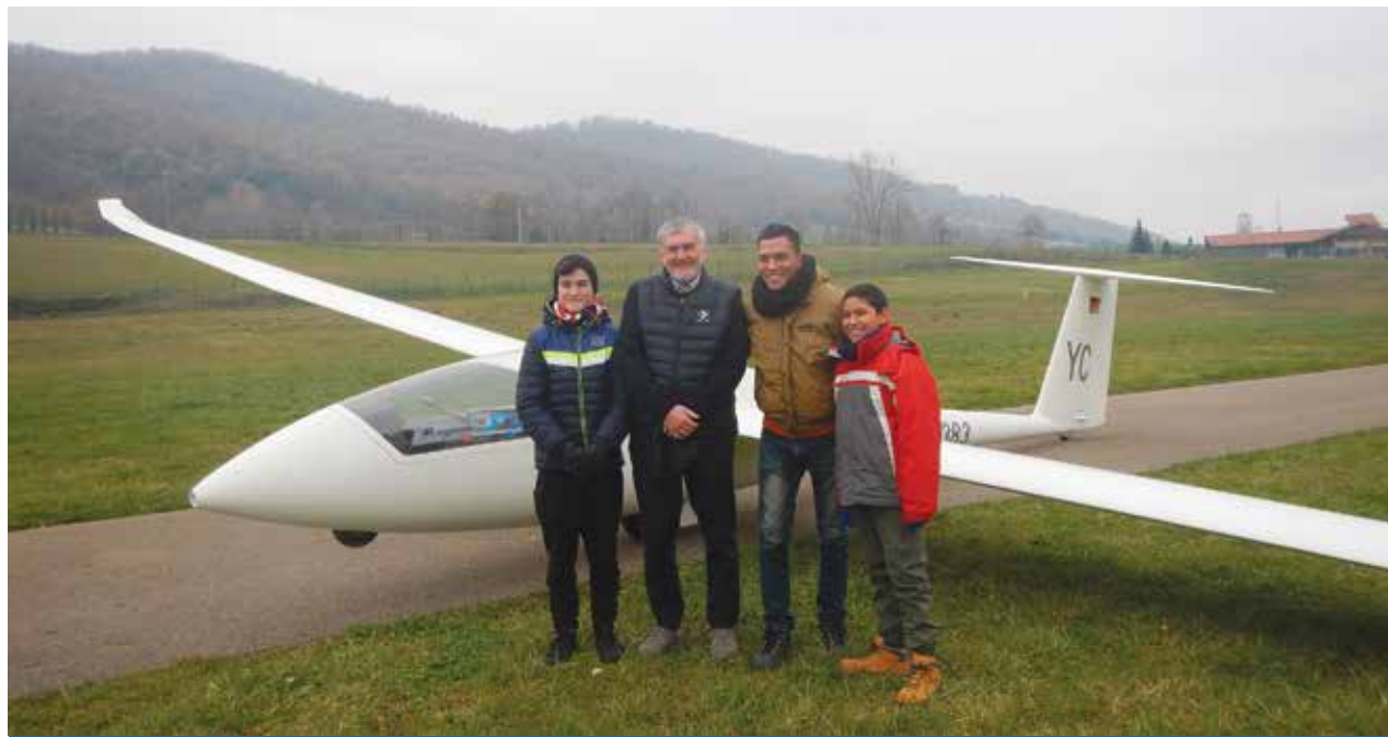
I giovani vincitori prima del volo in aliante a Pavullo