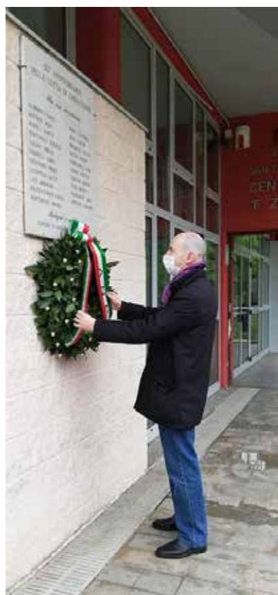
21 aprile 2020 - deposizione di una corona alla lapide dei Partigiani presso la sede del Quartiere