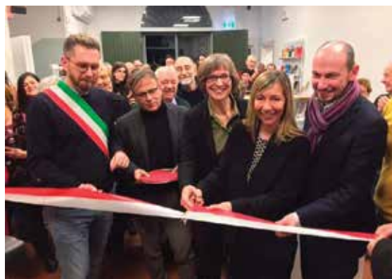
18 dicembre 2019 - inaugurazione dei nuovi spazi della Biblioteca Bartolotti in via Scandellara