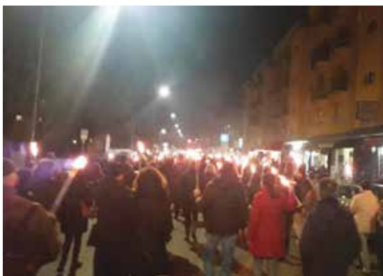
19 febbraio 2020 - la Fiaccolata contro l'odio in Via del Lavoro