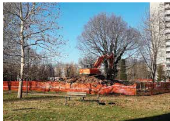
29 gennaio 2020 - iniziano i lavori per la Stazione dei Carabinieri al Pilastro