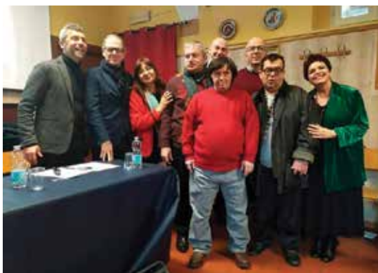
19 gennaio 2020 - inaugurazione del progetto Una Casa in San Donato della Fondazione Dopo di Noi