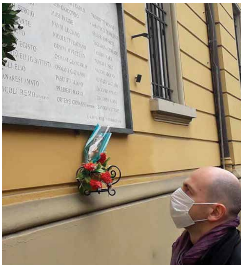
21 aprile 2020 - deposizione di una corona presso la lapide dei Partigiani in Cirenaica