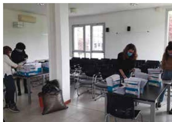
Volontarie al lavoro in Quartiere per imbustare le mascherine da consegnare a casa agli ultra75anni