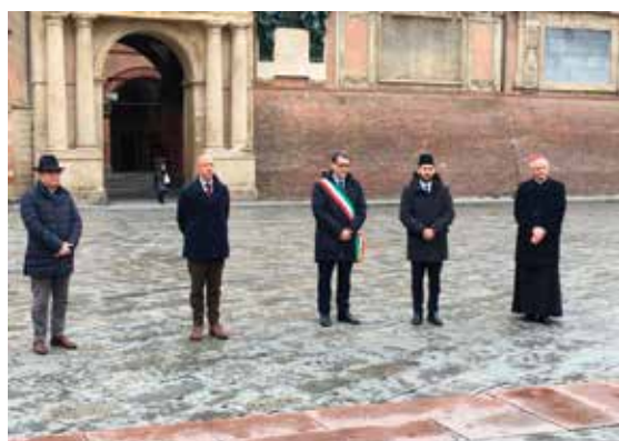
27 marzo 2020 in Piazza Maggiore Ricordo dei defunti a causa del Covid19