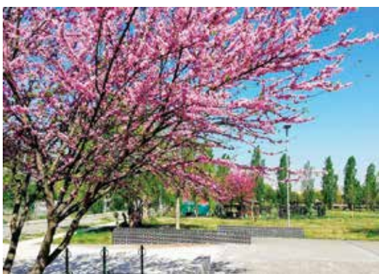
Primavera al Parco San Donnino