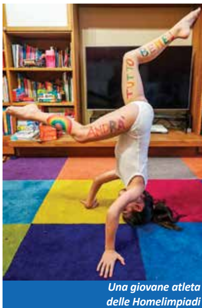
Una giovane atleta delle Homelimpiadi

Energym in questo mese e mezzo ha coinvolto i bambini piccoli e grandi, attraverso il canale You Tube (youtube energym https://www.youtube.com/watch?v=zsauwC7OBZg ) con dei percorsi motori di vario genere,