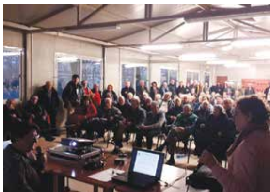
17 febbraio 2020 - incontro pubblico sulla riqualificazione degli Orti Salgari