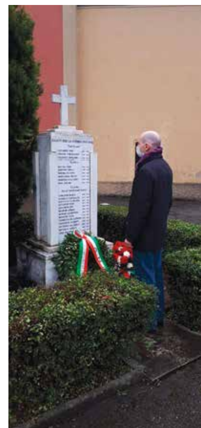
21 aprile 2020 - deposizione di una corona presso il cippo dei Caduti della Croce del Bianco

SanDonato-SanVitalenews - Periodico del Quartiere San Donato - San Vitale - Reg. Trib. Bologna n° 8341 del 22/04/2014 - Proprietà: Eventi s.c. a r.l.