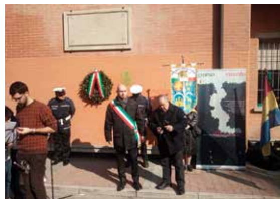
22 febbraio 2020 - Commemorazione alla lapide del Villaggio Giuliani e Dalmati