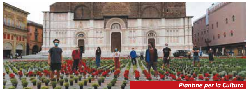
Piantine per la Cultura