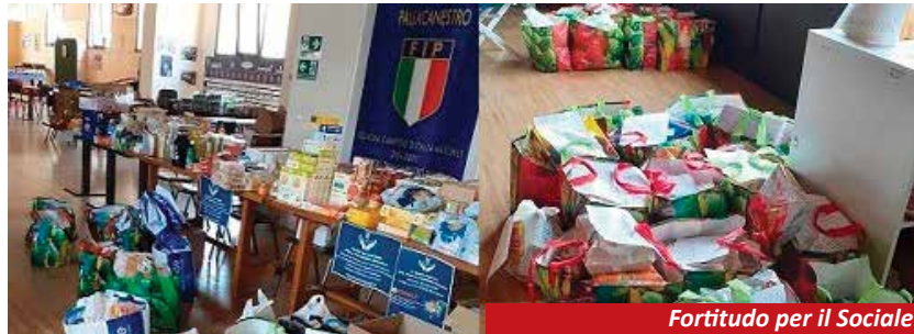
Fortitudo per il Sociale

E' stato poi realizzato il progetto "Il mio rifugio è un libro" partendo dall'esperienza del sostegno scolastico costruita in questi anni da queste Associazioni: con l'emergenza Covid-19 bambine/i e ragazze/i si sono ritrovati a casa, lontani dalla scuola, alle prese con i problemi di connessione e con la didattica online. La possibilità di raggiungere tutti e tutte è stata la prima preoccupazione dei doposcuola di comunità del Tpo e di Làbas che infatti hanno continuato a dare supporto a distanza.