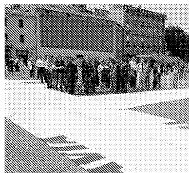
► Autorità e parenti delle vittime davanti all'opera d'arte in piazza VIII Agosto