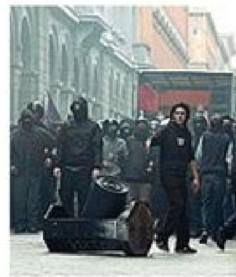
La protesta del 18 ottobre 2014