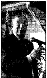
CORDENONS Il crollo del tetto e il ministro Francesco Profumo

Maroni ironizza su Facebook «E poi saremmo noi i razzisti»