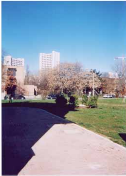
AUTORE Monica Hu