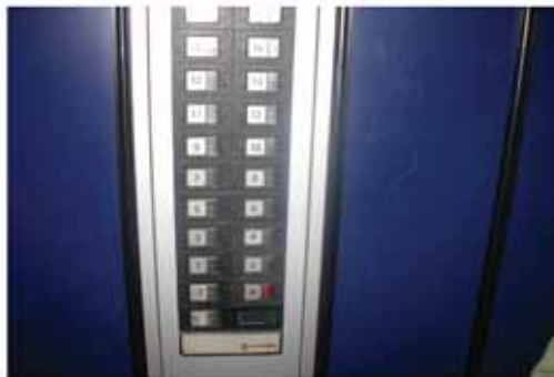
AUTORE Martina Minutoli