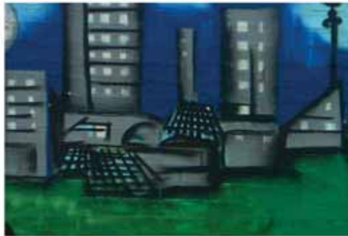
AUTORE Giulia Belfiori