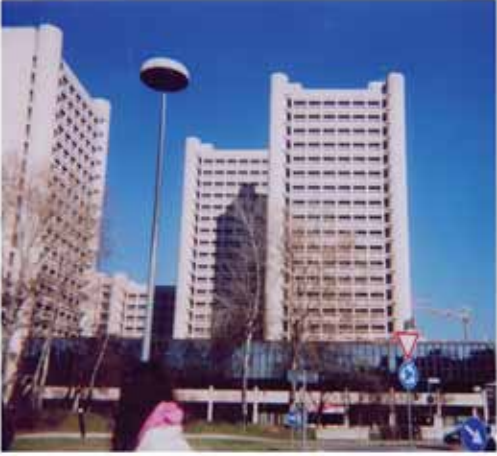
AUTORE Sara Monachini